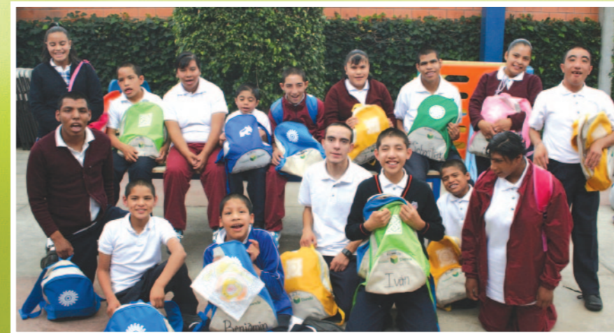
Ciudad de México, Septiembre 2013

La alegría es la expresión genuina de los habitantes de la casa cuando conviven, van a la escuela, reciben visitas o preparan una fiesta—las sonrisas y alegrías acompañarán estas páginas y quieren contagiarlos e invitarlos a que se sigan sumando a esta causa y aporten sus Granitos de Arena. ¡Mil gracias!