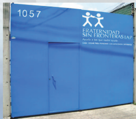
Ciudad de México, Septiembre 2012

Sin su acompañamiento como donante, voluntario, empleado o patrono, esa labor no sería posible. ¡Gracias por sumar y aportar cada quien su Granito de Arena!